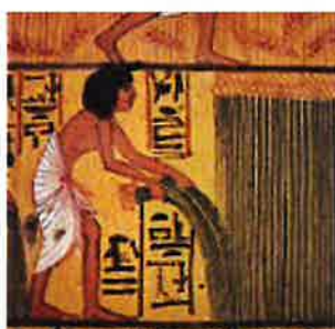
Très rare : fresque représentant un installateur de fibre optique en Egypte ancienne.

Un des secteurs qui ont connu les plus grands bouleversements est certainement celui des télécommunications. Au début des années 1980, nous ne connaissions que le téléphone de France Telecom et sa ligne de cuivre. Le fax permettait déjà d'envoyer des documents. Puis les modems (modulateur/démodulateur) permirent de communiquer avec des ordinateurs (applications bancaires) et ouvrirent la porte au fameux Minitel . Tous cela sur la même ligne mais avec une seule utilisation à la fois (soit téléphone, soit communication). L'ADSL permettant de coder plusieurs informations en même temps sur la même ligne et à une vitesse plus importante s'est imposée en parallèle avec le développement d'internet. Une seule ligne permettait désormais la téléphonie et les communications (internet) en même temps grâce à la « BOX ». Ce fut aussi l'apparition de la concurrence et des opérateurs alternatifs qui, louant les lignes de France Telecom/Orange, proposaient des offres toujours plus alléchantes. Jusque là, tout se passait toujours sur le fil de cuivre. Si la propagation de l'électricité sur le fil de cuivre se fait à 70 % de la vitesse de la lumière, elle se dégrade en fonction de la longueur du fil en raison de sa résistance au passage du courant. De plus, chaque raccordement est sensible à la corrosion. C'est la raison pour laquelle ceux qui sont en bout de ligne sont pénalisés avec un débit réduit.